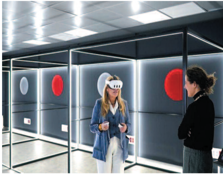
En la inauguración, a la que ha acudido la consejera de Economía, Hacienda y Empleo de la Comunidad de

Algunas de las acciones que se están desarrollando a día de hoy son: el Circuito Empléate, en el que se trabajan técnicas de comunicación enfocadas a las entrevistas laborales; la evaluación de competencias mediante gaming en el teléfono móvil; la realización de un vídeo currículum; el reparto de licencias LinkedIn Learning para aprender las competencias clave para los nuevos puestos de trabajo y además desarrollan dinámicas de intercambio de habilidades, entrevistas rápidas o job speed dating, eventos de talento junior y senior, y diversas jornadas de trabajo.